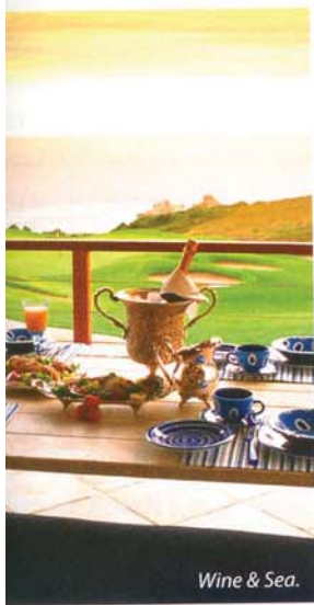
Wine & Sea.